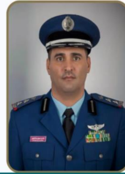
العقيد الطيار الركن / ماجد الجميد

مساعد مدير مركز المعلومات الوطني للتعرف المتقدم والهوية الرقمية الهيئة السعودية للبيانات والذكاء الاصطناعي (سدايا) دكتوراه في علوم الحاسب الآلي