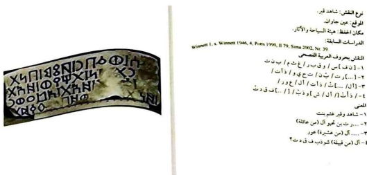
شكل ٢: نقوش 23

وهذا النص يوضح أقسام النسب؛ إذ ذكر فيه الاسم، والأب، والعشيرة، والقبيلة (السعيد 1440).