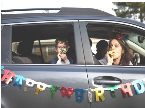
الصورة الإخبارية الثانية لكوفيد-19

نتائج التساؤل الثاني: ما الدلالة البصرية والاجتماعية للصورة الإخبارية الثانية لجائحة كورونا؟. وللإجابة على هذا التساؤل قام الباحثون بحساب المتوسط الحسابي لكل مفردة من مفردات الاستبانة وقيمتي (d,t) لكل مفردة من مفردات الاستبانة لقياس دلالة الفروق بمقارنة متوسط العينة بالمتوسط الفرضي (3) وحجم التأثير (d) والجداول التالية (3-5) توضح ذلك: