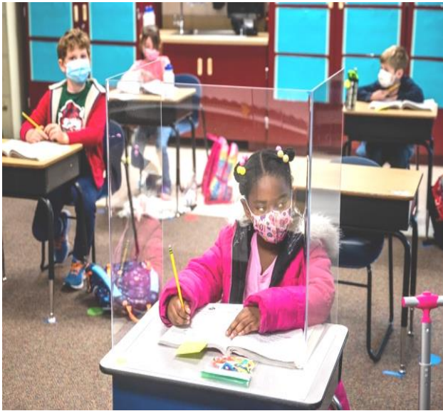
الصورة الإخبارية السادسة

نتائج التساؤل السادس: ما الدلالة البصرية والاجتماعية للصورة الإخبارية السادسة لجائحة كورونا؟، حيث قام الباحثون بحساب المتوسط الحسابي لكل مفردة من مفردات الاستبانة وقيمتي (d,t) لكل مفردة من مفردات الاستبانة لقياس دلالة الفروق بمقارنة متوسط العينة بالمتوسط الفرضي (3) وحجم التأثير (d) والجداول التالية (22-27) توضح ذلك: