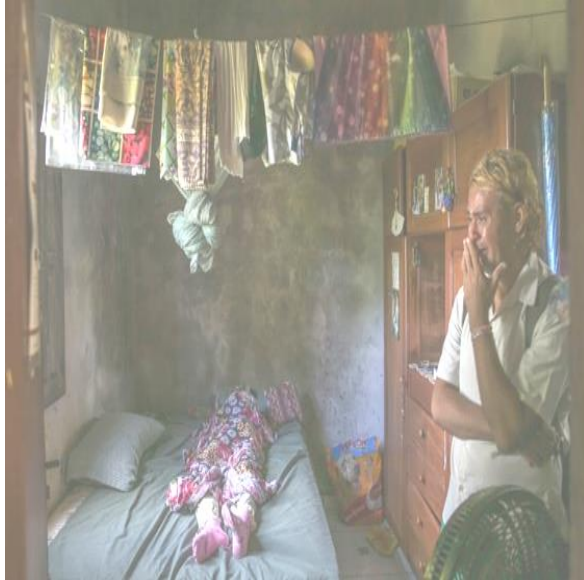
الصورة الإخبارية الرابعة لكوفيد-19

نتائج التساؤل الرابع: ما الدلالة البصرية والاجتماعية للصورة الإخبارية الرابعة لجائحة كورونا؟. وللإجابة على هذا التساؤل قام الباحثون بحساب المتوسط الحسابي لكل مفردة من مفردات الاستبانة وقيمتي (d,t) لكل مفردة من مفردات الاستبانة لقياس دلالة الفروق بمقارنة متوسط العينة بالمتوسط الفرضي (3) وحجم التأثير (d) والجداول التالية (12-16) توضح ذلك: