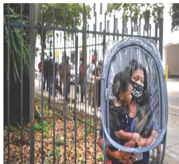
الصورة الإخبارية الخامسة

نتائج التساؤل الخامس: ما الدلالة البصرية والاجتماعية للصورة الإخبارية الخامسة لجائحة كورونا؟ وللإجابة على هذا التساؤل قام الباحثون بحساب المتوسط الحسابي لكل مفردة من مفردات الاستبانة وقيمتي (d,t) لكل مفردة من مفردات الاستبانة لقياس دلالة الفروق بمقارنة متوسط العينة بالمتوسط الفرضي (3) وحجم التأثير (d) والجدول التالي (21-17) توضح ذلك: