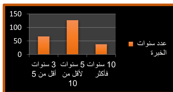
شكل ٢: يوضح عدد سنوات الخبرة بالنسبة لعينة الدراسة

جاء في الترتيب السابع عبارة "توفر لي الكلية فرص كافية للتدريب والتطوير المهني" بانحراف معياري (0.81)، وقوة نسبية (70.5%)، وهذا ما اشارت الي دراسة (زايد، 2003م) بان جودة الاداء هدف لتحقيق التميز من خلال التطوير المستمر بالاعتماد على التدريب كآلية لتنمية