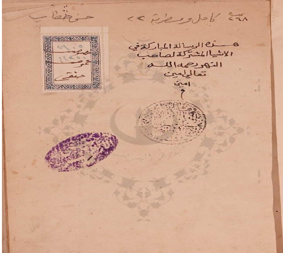
الصفحة الأخيرة من المخطوط