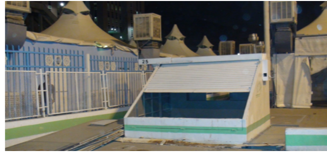
مخزن ارضي للتخلص من نفايات الحاوية السوداء