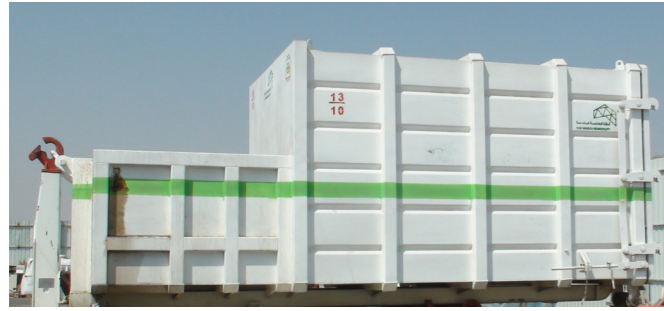
صندوق ضاغط لتخزين نفايات الحاوية الزرقاء

تشغيل مفتاح الأمان بدورانه قليلاً لبدأ التشغيل