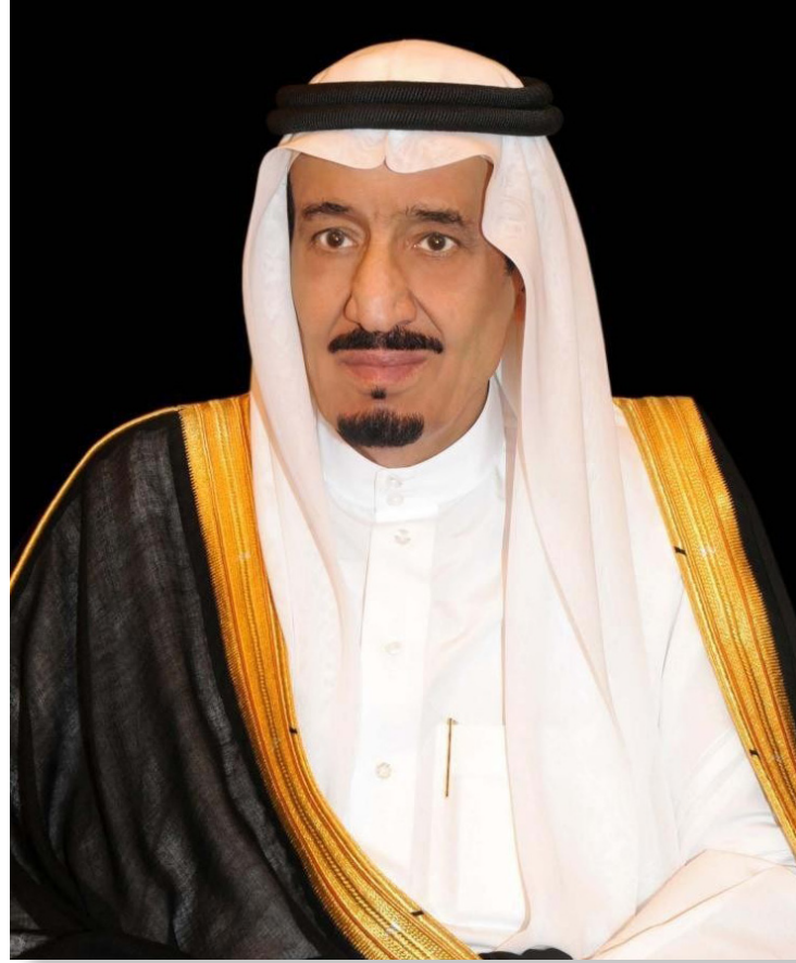
صاحب السمو الملكي الأمير سلمان بن عبدالعزيز آل سعود ولي العهد، نائب رئيس مجلس الوزراء، وزير الدفاع نائب رئيس مجلس الخدمة المدنية - حفظه الله