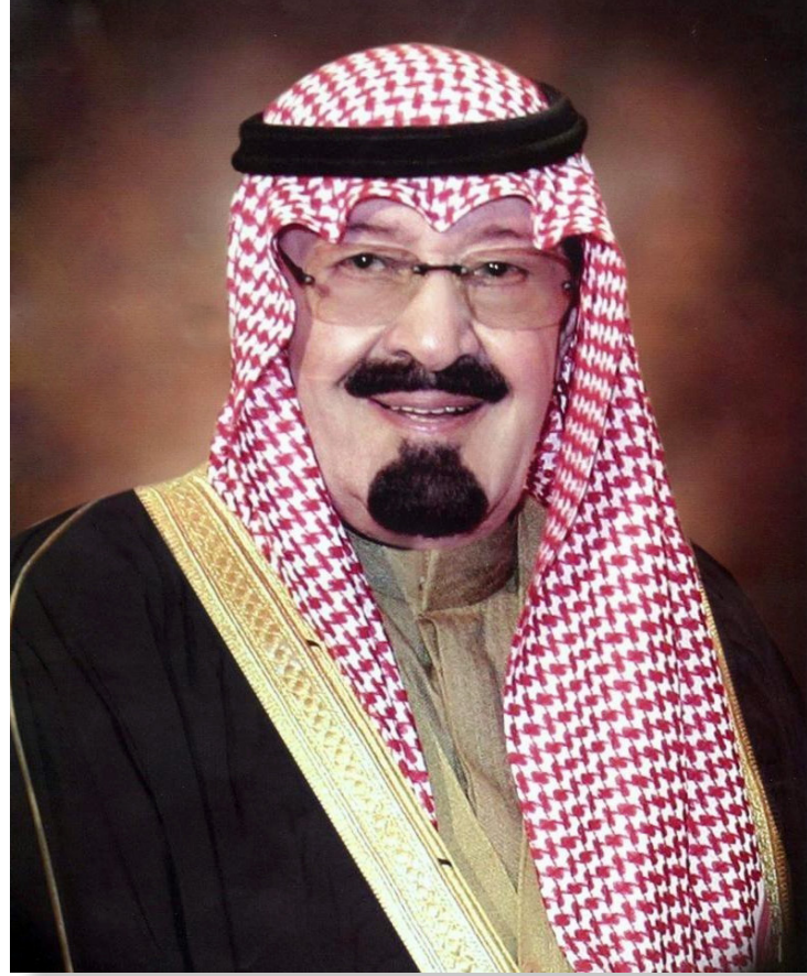
خادم الحرمين الشريفين الملك عبد الله بن عبد العزيز آل سعود رئيس مجلس الوزراء رئيس مجلس الخدمة المدنية - حفظه الله