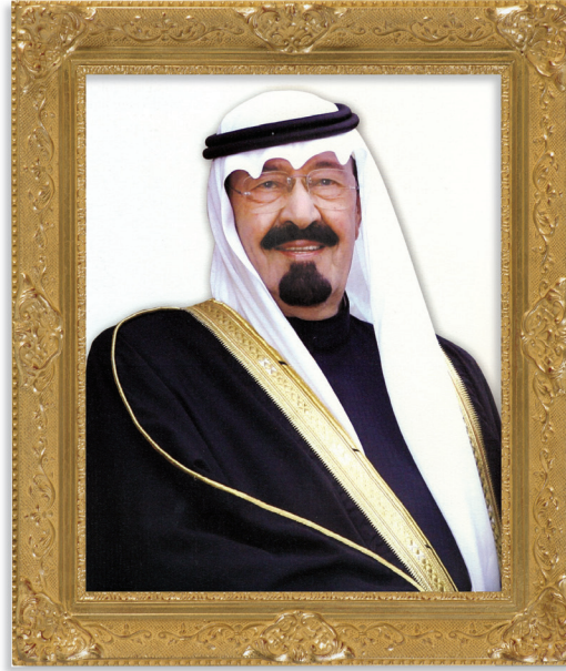
خَازِمُ الطَّرِيفِيِّينَ الْمَلِكُ مُحَمَّدُ عَبْدِ اللَّهِ بْنِ عَبْدِ الْعِزِّزِ السُّعُودِ رئيس مجلس الوزراء ورئيس مجلس الخزانة العامة - حفظه الله -