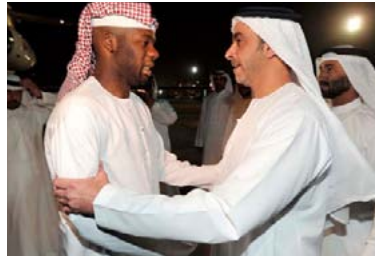
جميع وثائق التأمين الصحي تغطي الحالات الطارئة من دون موافقات الصباح

اعتبر المتحدثون، في الجلسة الرابعة من فعاليات اليوم الثاني بمنتدى الإعلام العربي، التي عقدت، أمس، بعنوان «الإعلام الساخر». هل تنسج له صدور، وهو «أحد الألوان المهمة في الإعلام، ويحتاج إلى مهارات شخصية، لا تتوافر في جميع الإعلاميين». وأضافوا، خلال الجلسة التي أدارها الإعلامي اللبناني، غير عبد الكريم - أوطيبي