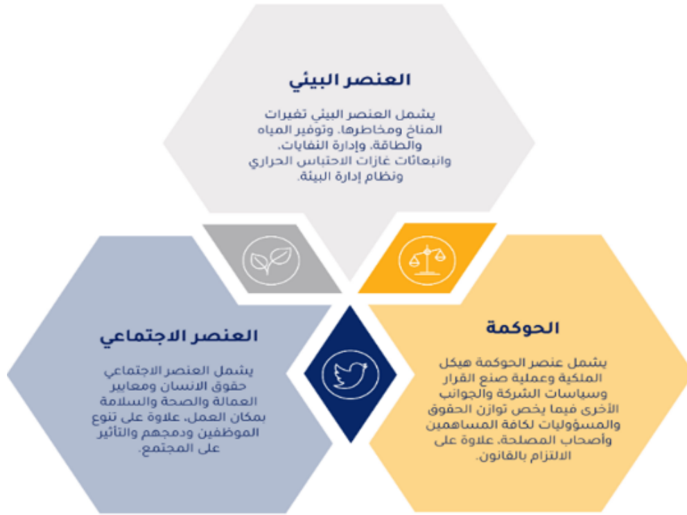
شكل ١: شكل 1